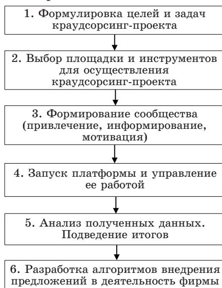
Рис. 3. Алгоритм проведения краудсорсинг-кампании (Составлено по: [8; 9])

Однако вероятность того, что реализация любой из моделей краудсорсинга без опоры на четкий алгоритм действий приведет организацию к успеху, крайне низка. Одним из вариантов проведения краудсорсинг-кампании может послужить алгоритм, представленный на рис. 3.