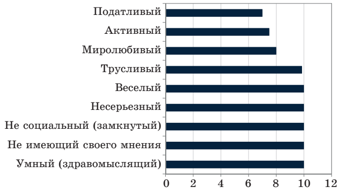
Рис. 2. Конструкты ролевого персонажа «Предатель»

Анализ полученных данных позволил нам выделить конструкты, характеризующие образ гражданина (наиболее часто повторяющиеся и более высоко оцениваемые в описании разных ролевых позиций) в представлениях студентов. Результаты последующей оценки гражданина по выделенным конструктам показаны на рис. 3.