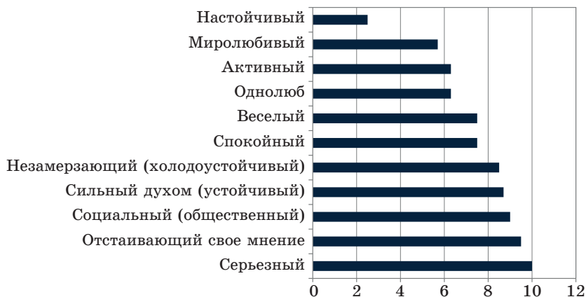
Рис. 1. Конструкторы ролевого персонажа «Защитник»

Мы выбрали те качества, которые наиболее часто повторялись у респондентов и таким образом получили конструкторы выделенных выше ролевых позиций. На рис. 1 представлен портрет ролевого персонажа «Защитник».